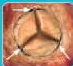
Non Lotus™ Valve Arrows show areas of PVL