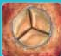
Lotus™ Valve The Lotus™ valve conforms to the anatomy and promotes annular sealing